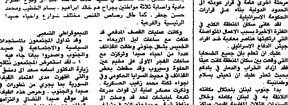
جنود مندسة يتخفون على المواقع